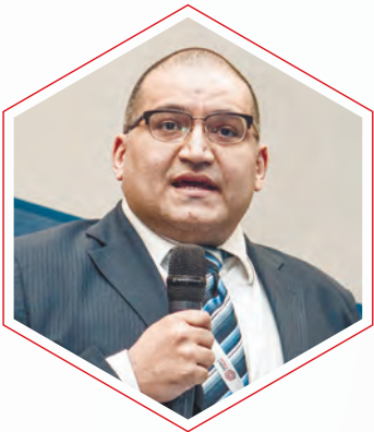
Рикардо Алехандро Картайя Ортуньо Директор строительного направления по России Строительной палаты Республики Венесуэла

Международный базальтовый Форум дал нам видение применения базальтовых материалов в строительной отрасли. Именно эти новые материалы ложатся в основу новой государственной программы.